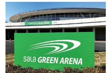
浜松市とネーミングライツパートナー 契約を締結した「サーラグリーンアリーナ」