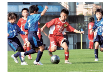
ジュニア層を対象にした サッカー大会「サーラカップ」

サーラグループのファミリーイベント。当日は1,000名を超える社員と家族が静岡県掛川市の「つま恋リゾート」へ集結! 各種スポーツ大会や「ジュビロ磐田」のサッカー教室など、同僚や家族と楽しめるプログラムが満載です!