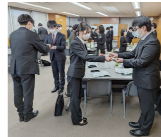
新入社員研修(ビジネスマナー)

階層別研修、目的別研修など多様なプログラムがあり、新入社員から管理職層まで、社員それぞれが自身のキャリア形成のタイミングに応じて手を挙げて参加できます。このほか、会社別の専門教育やメンター制度、動画学習、越境学習など、社員の成長支援のため様々な教育に力を入れています。