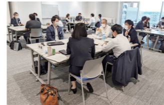
セルフアセスメント研修 (リーダー層社員が若手社員にアドバイス)