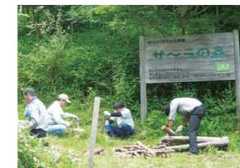
環境保全活動(サーラの森)