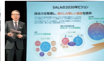
サーラグループ全社員ミーティング